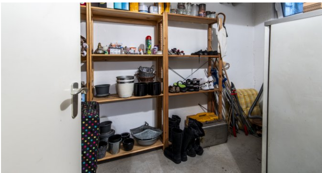
separater Abstellraum im Hobbyraum