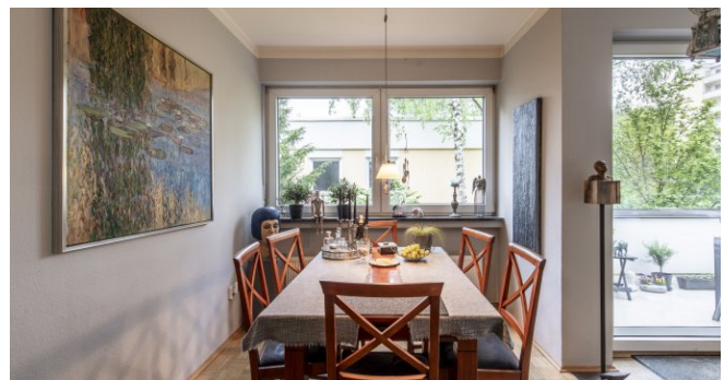
Essbereich im Wohnzimmer