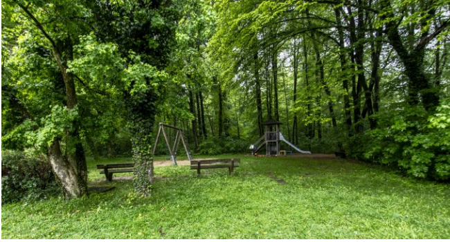
Kinderspielplatz auf dem Gelände