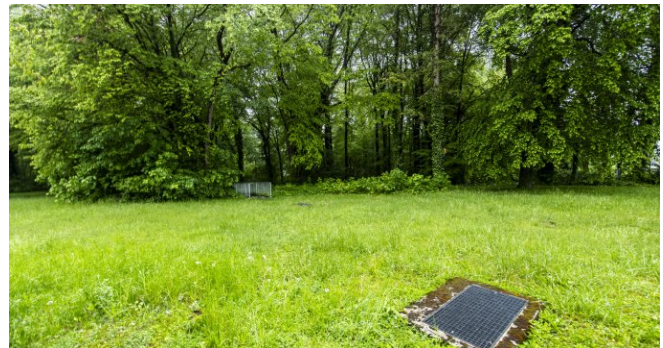
Blick in den Park