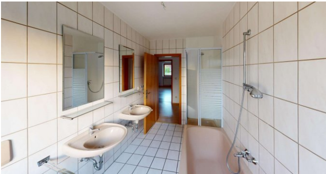
Tageslichtbad mit Wanne und Dusche