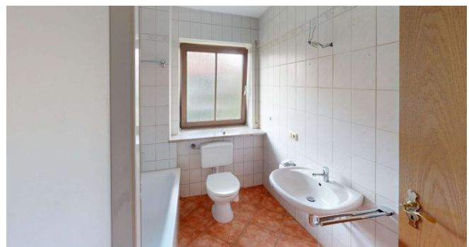
Tageslichtbad mit Badewanne