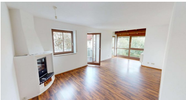
Wohnzimmer mit Kamin Attrappe