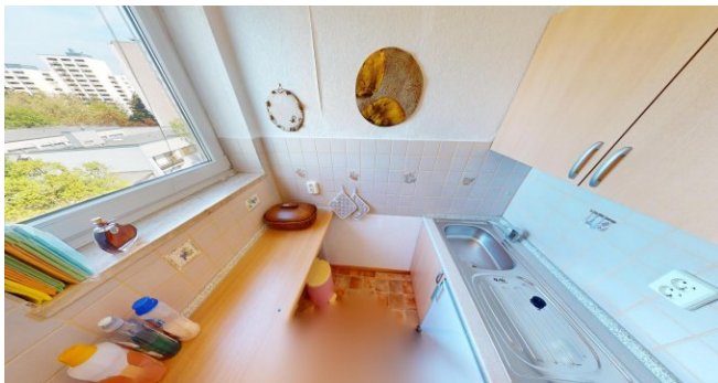
Küche mit Fenster

info@perkmann-immo.de www.perkmann-immo.de