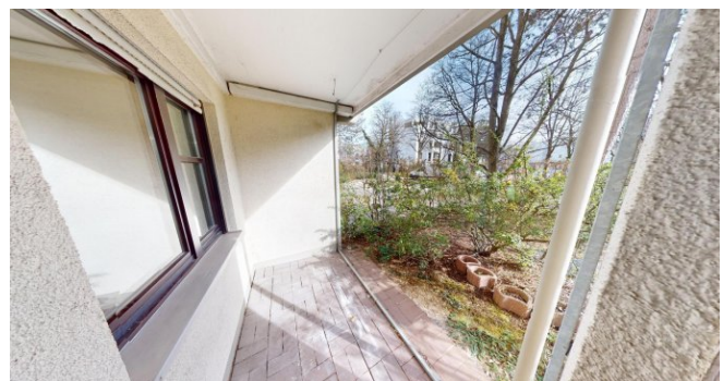
Terrasse mit Gartenanteil