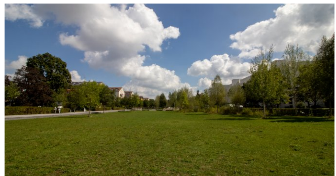
Parkanlage vor der Haustüre